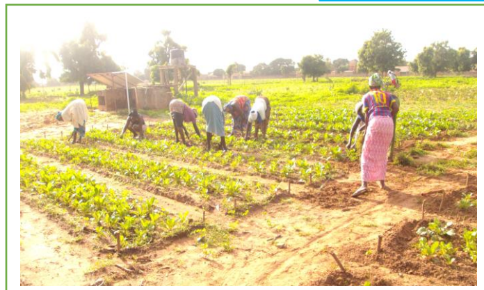
Entretien des planches par les relais