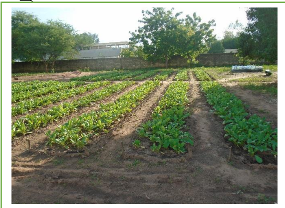
Planches de navet réalisées par les relais