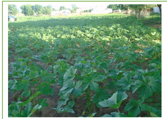
Planches de gombo réalisées par les relais